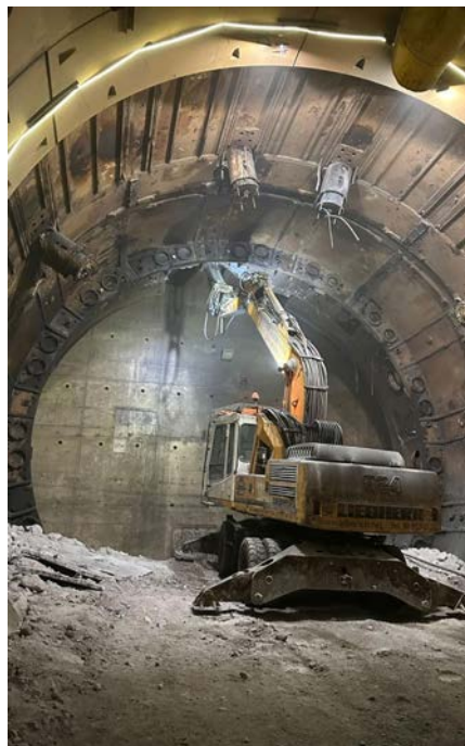
Desmuntatge complet de la tuneladora fora de servei a Lesseps. L9/L10