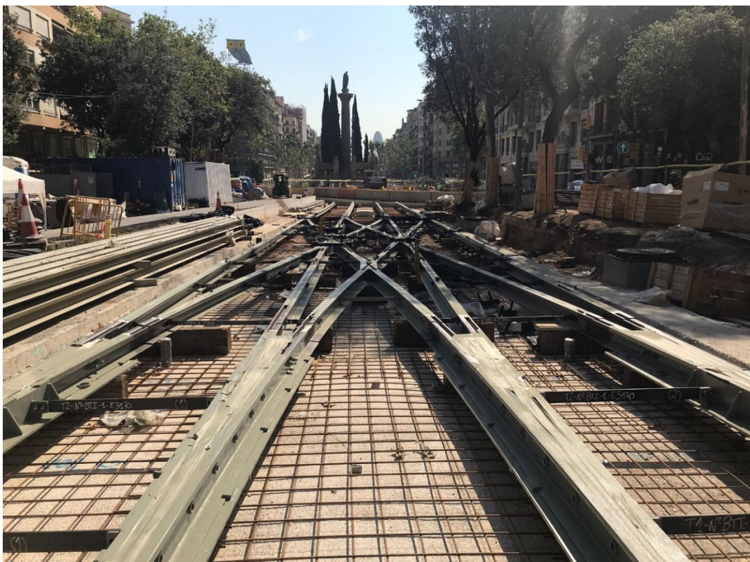
Muntatge d'aparell de via

En el projecte de la xarxa tramviària per la Diagonal de Barcelona cal destacar, en relació amb l'obra civil (lots 1 a 4), la continuació del muntatge de via i aparells de via en tots els trams del nou traçat, llevat a les cruïlles, les quals s'executaran en els mesos estivals per minimitzar l'afectació al trànsit. També s'ha iniciat el muntatge del sistema d'alimentació contínua pel terra amb la instal·lació del tercer carril. Durant aquest segon trimestre s'ha avançat en els treballs de construcció de la nova plataforma tramviària en l'àmbit del futur intercanviador de Glòries, culminant-los amb el necessari tall del servei del tramvia en aquest punt per poder connectar el nou traçat amb les vies existents. El tall de servei es va iniciar el 26 de juny i està previst restablir-lo l'1 de setembre.