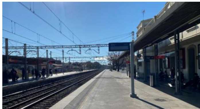
Estació de Castelldefels

Adif impulsarà la renovació i modernització de l'estació de Castelldefels amb una inversió aproximada de 10 M€. S'adaptaran les instal·lacions de senyalització i telecomunicacions de l'estació al nou esquema de vies (treballs recentment contractats per 20,2 M€) que permetrà la separació de les circulacions passants de Mitja i Llarga distància evitant la interferència amb els serveis de Rodalies.