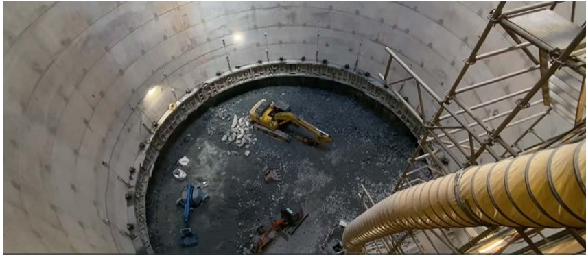
Pou de l'estació de Sarrià. L9/L10

Es preveu que a finals de l'any 2024 estarà excavat tot el túnel amb la voluntat que a l'any 2027 puguin circular les unitats de tren d'extrem a extrem, si bé només s'aturarà en aquelles estacions que s'hagin pogut posar en servei.