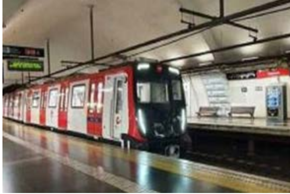
Sèrie 8000 de Metro de línia L1