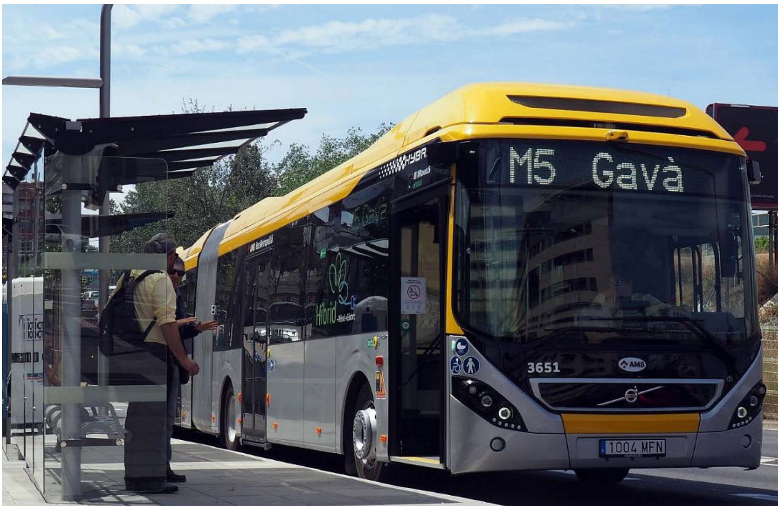
Vehicle de la nova línia M5

L'Àrea Metropolitana de Barcelona (AMB) va posar en servei el mes de maig una nova línia metropolitana de Metrobús, l'M5, d'alta freqüència de pas (10 minuts) que connecta els municipis de l'eix C-245 Castelldefels, Gavà, Viladecans i Sant Boi de Llobregat amb l'intercanviador de Cornellà (L5 de Metro, Trambaix i Rodalies). Aquesta actuació correspon a la fitxa del pdI TPC04. Plataforma reservada a la C-245 entre Cornellà-Sant Boi-Castelldefels.