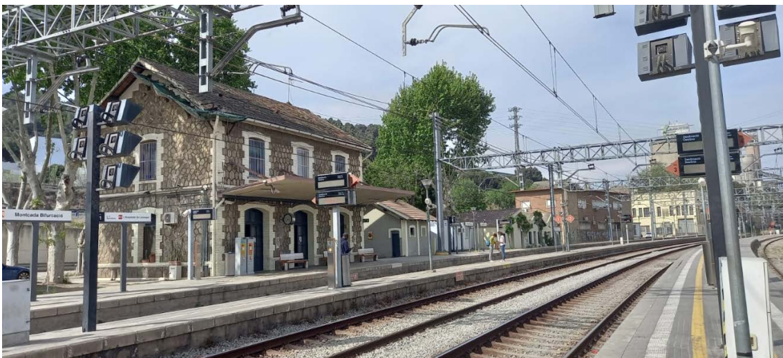
Estació de Montcada Bifurcació

Adif també ha iniciat els tràmits per a la licitació per a la remodelació de l'estació de Montcada Bifurcació per un import de 33,7 M€. El seu objectiu és l'increment de la capacitat de la infraestructura per a circulacions de les línies de Rodalies, incrementar la versatilitat dels encaminaments cap als túnels de Barcelona i incrementar l'accessibilitat del conjunt de l'estació. En el futur es preveu que aquesta estació pugui ser capçalera d'alguns serveis Regionals i de Mitjana Distància que ara acaben a l'estació de França.