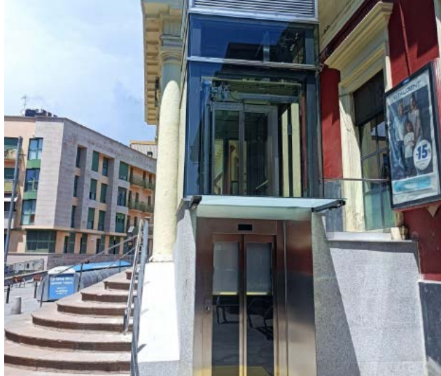
Nou ascensor a l'estació de Molins de Rei

Pel que fa actuacions a les estacions, Renfe ha substituït l'ascensor de Molins de Rei com a primer pas en la millora de l'accessibilitat de l'estació, pendent d'actuar a les andanes, amb una inversió total de 6 M€