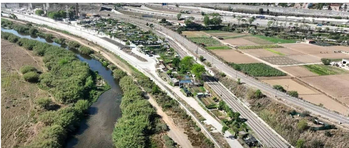
Vista aèria de la zona d'actuació

Les obres en el tram Parets – La Garriga continuen progressant. Està en procés de licitació l'estudi informatiu del tram Centelles - La Garriga.