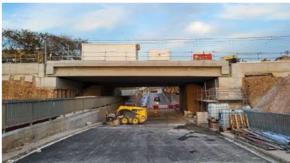
Pas inferior del carrer Comerç

Continuen les obres per a la integració urbana de Sant Feliu de Llobregat . S'ha posat en servei l'ampliació del pas inferior del carrer Comerç, amb dos carrils i vorera a cada banda i s'ha tancat el pas inferior de la carretera de Sansón, que permetrà l'excavació del futur tram soterrat en el costat de molins de Rei. Aquesta actuació té un pressupost de 120 M€ que té com a principal objectiu la permeabilitat transversal de la trama urbana, a part d'altres instal·lacions ferroviàries.