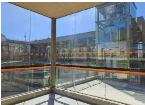
Imatge de l'estació de Vilafranca del Penedès

Continuen les obres per a la integració urbana de Sant Feliu de Llobregat . S'ha posat en servei l'ampliació del pas inferior del carrer Comerç, amb dos carrils i vorera a cada banda i s'ha tancat el pas inferior de la carretera de Sansón, que permetrà l'excavació del futur tram soterrat en el costat de molins de Rei. Aquesta actuació té un pressupost de 120 M€ que té com a principal objectiu la permeabilitat transversal de la trama urbana, a part d'altres instal·lacions ferroviàries.