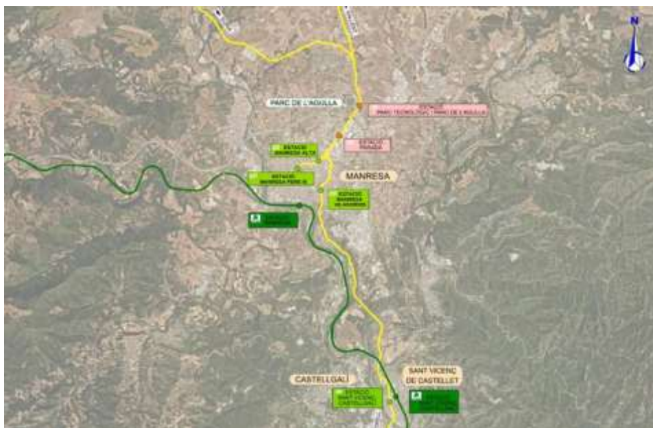
Situació de les dues noves estacions en estudi (en taronja)

Aquesta actuació permetria l'accés a la zona nord del municipi del trens procedents de Barcelona mitjançant una reversió de marxa a la futura estació de Pere III.