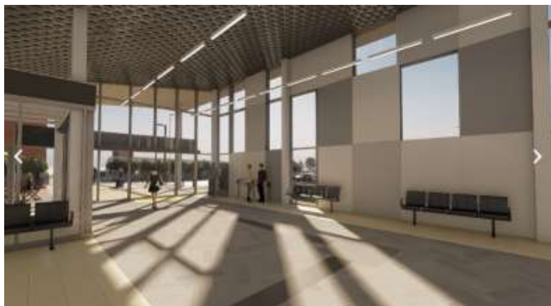
Imatge virtual de la futura estació de Parets del Vallès

ADIF està finalitzant el projecte constructiu de la nova estació de Parets del Vallès , amb la previsió de contractar les obres aquest mateix any. L'actuació suposa una millora de la integració de les futures instal·lacions ferroviàries en el nucli urbà, la qual cosa es traduirà amb un major confort i funcionalitat. El pressupost és de 17,8 M€ i serà compatible amb la duplicació de la línia R3.