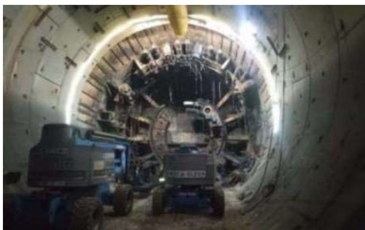
Estat general de desmuntatge de la tuneladora tram 3 Lesseps-Sagrera Meridiana

A la xarxa de Metro cal destacar també la posada en servei del nou vestíbul de l'L1 situat davant del centre comercial Les Arenes, que inclou un ascensor per accedir a l'andana sentit Hospital de Bellvitge. A l'estació de Maragall, s'han reprès les obres de millora de l'accessibilitat de l'intercanviador, on es preveu la instal·lació de dos nous ascensors en el vestíbul, un pel carrer i l'altre per l'andana.