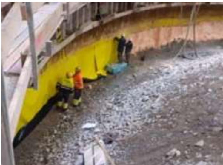
Impermeabilització de l'anell 11 a l'estació de Sarrià