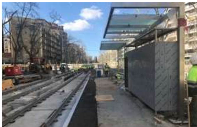
Instal·lació de les marquesines

A l'estació de Glòries, s'ha tancat la solució de la subcentral elèctrica de Glòries i s'ha resolt el disseny de la catenària. Finalment, esmentar que s'han tractat temes de disseny exterior, de cabina i sala de passatgers del nou material mòbil, i les especificacions dels equips embarcats.