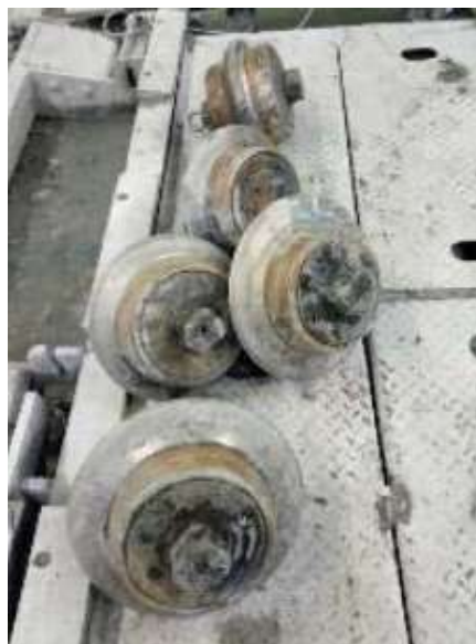
Canvi de talladors de la roda de tall

Amb data març de 2023, les principals tasques realitzades en el tram 3 Zona Universitària-Mandri han estat la finalització de l'excavació del tram de pissarres, la revisió de la roda de tall i el canvi de talladors i l'inici de l'excavació del nou tram de granit en sentit Sarrià. Es porten excavats 1 km dels 4,2 km previstos. La tuneladora es troba a 500 metres de l'estació de Sarrià.