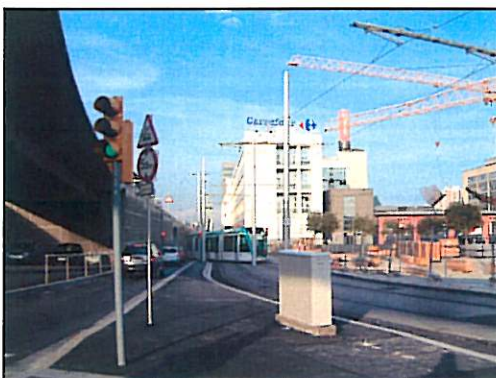
Circulació tramvies des de parada La Farinera