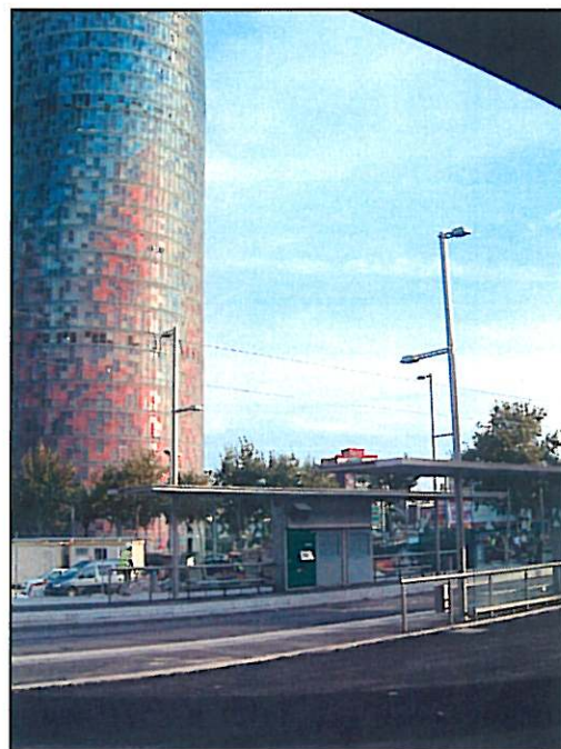
Parada La Farinera