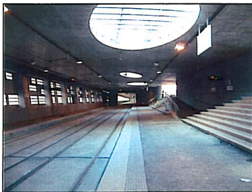
Accés a andanes interior calaix