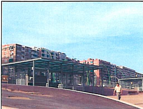
Marquesines parada Espronceda