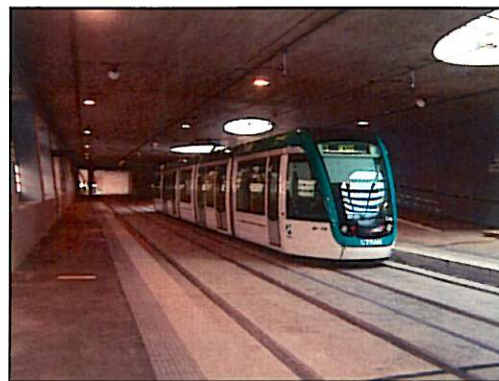
Circulació tramvies interior calaix