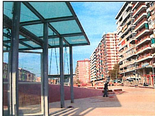
Detall marquesines parada Espronceda