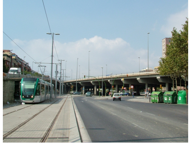
Avda. Gran Via de les Corts Catalanes (Sant Adrià de Besòs)