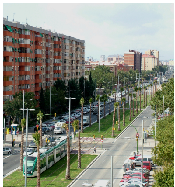
Avda. Marquès de Montroig (Badalona)