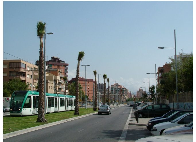
Avda. Marquès de Montroig (Badalona)