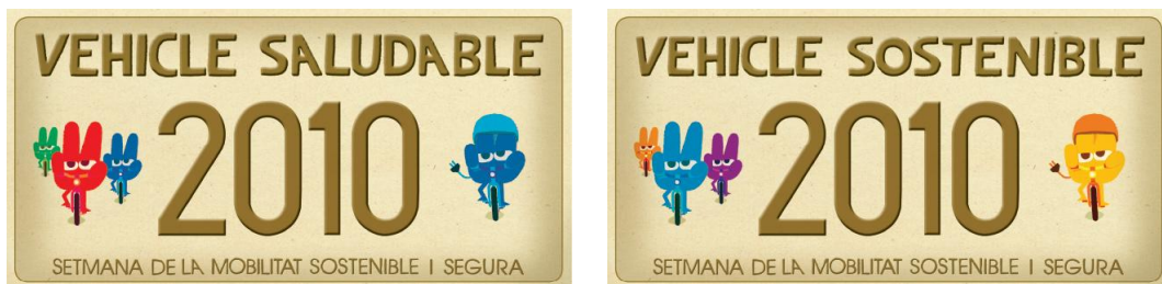
Matrícules de les bicis participants a les pedalades

Com s'ha comentat, com a novetat dins de les pedalades, s'ha preparat també una activitat específica per a públics adolescents. Amb bici a l'institut? proposa als estudiants de secundària anar a classe en bici durant la Setmana en els municipis de Calldetenes, Gurb, Manlleu, Masies de Voltregà, Prats de Lluçanès, Sant Quirze de Besora, Taradell, Tona, Torelló, Torelló, Vic i la Garriga.