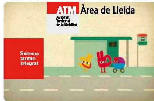
Funda i targeta commemorativa de l'ATM Àrea de Lleida