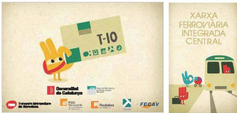
Funda i portada del mapa de la xarxa ferroviària integral central de l'ATM de Barcelona