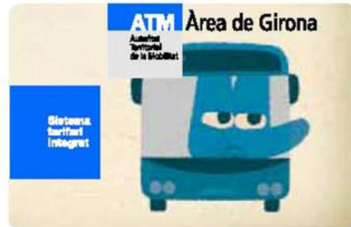
Funda i targeta commemorativa de l'ATM Àrea de Girona