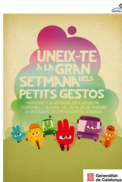
Cartell de la Setmana de la Mobilitat Sostenible i Segura 2010

A Catalunya, la Setmana de la Mobilitat Sostenible es va celebrar per primera vegada l'any 2001, mentre que la resta de països europeus adherits a la jornada sense cotxes també celebren una Setmana Europea de la Mobilitat Sostenible des del 2002. D'aquesta manera, Catalunya acull aquests dies la Setmana de la Mobilitat conjuntament amb més de 30 països i 1.300 ciutats de tot Europa.