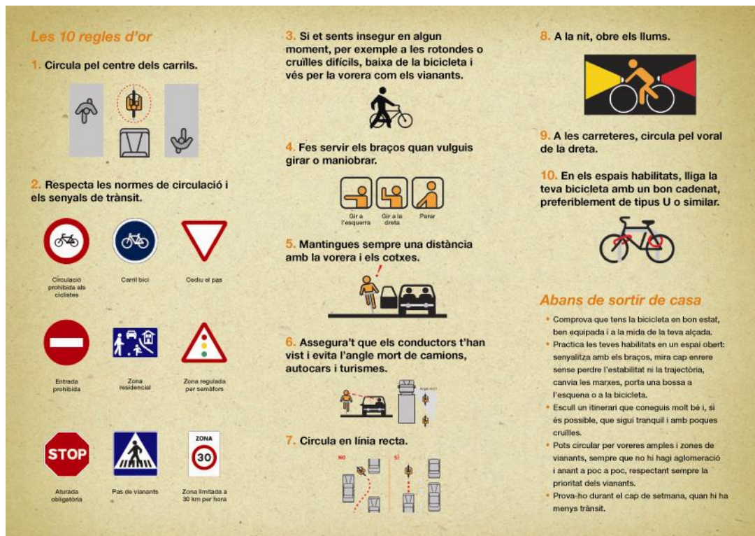
Fullet informatiu pels estudiants de secundària