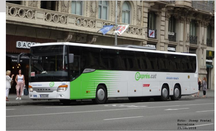
Barcelona 29/08/2018